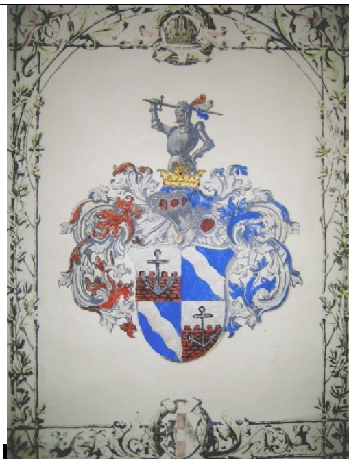
von Hackenschmidt Wappen - Wien/Linz(Austria)