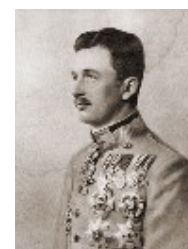
Emperor Karl I (IV) 1887 - 1922