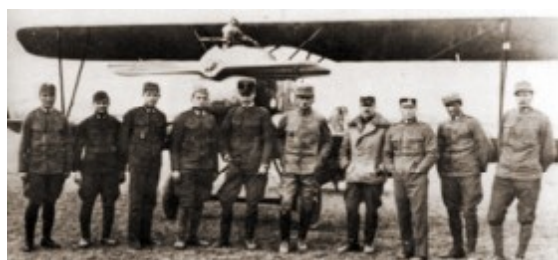
Personnel of KuK Flik 61j March, 1918