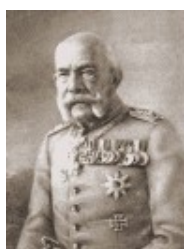
Emperor Franz Josef 1830 - 1916